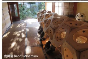
※画像は過去作品のため、今回の展覧作品およびインスタレーションではございません。